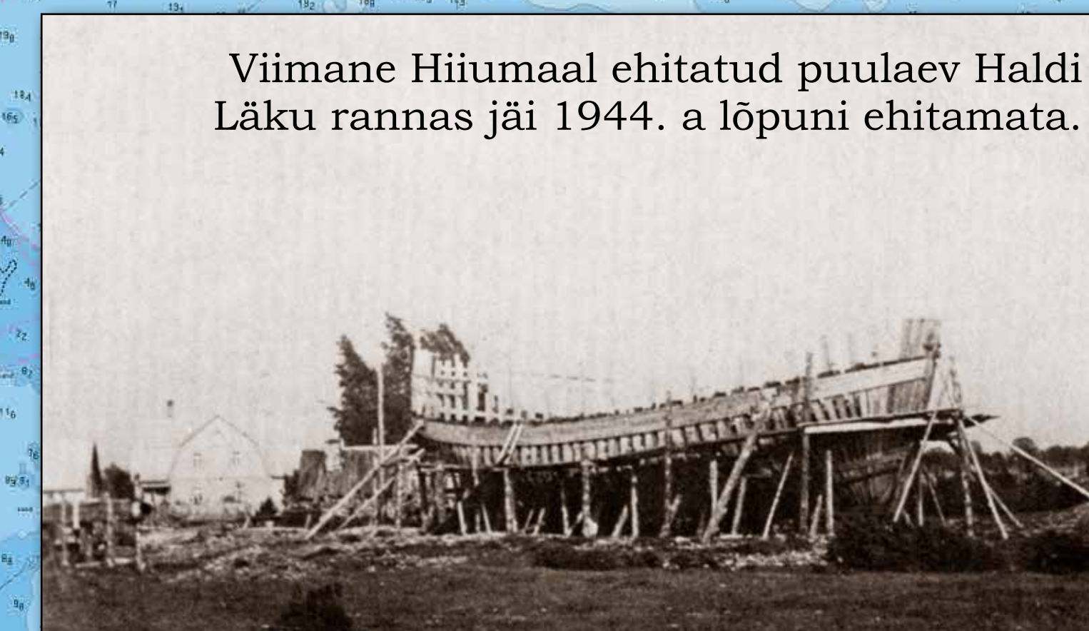
Viimane Hiiumaal ehitatud puulaev Haldi Läku rannas jäi 1944. a lõpuni ehitamata.

Ehitas 19. sajandi lõpuastail - 20. sajandi alguses üle 20 laeva.